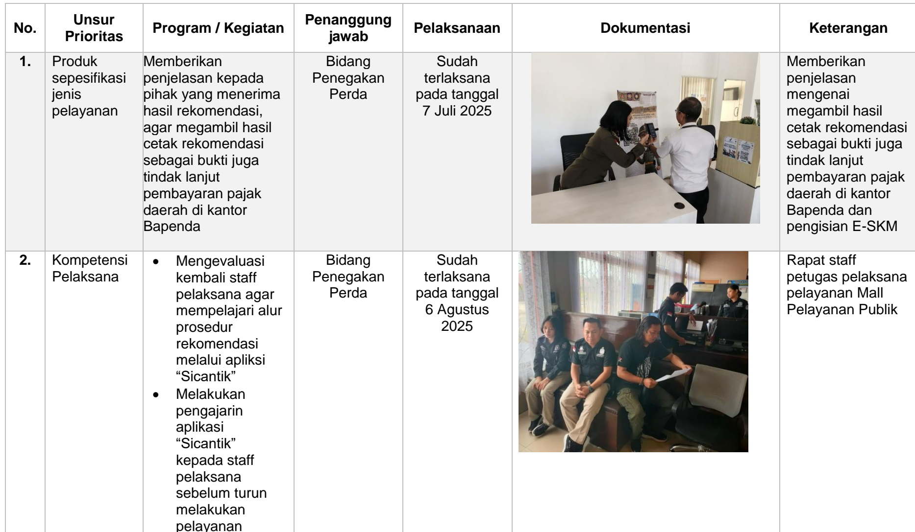
Tabel 3. Realisasi Rencana Tindak Lanjut Sebelumnya